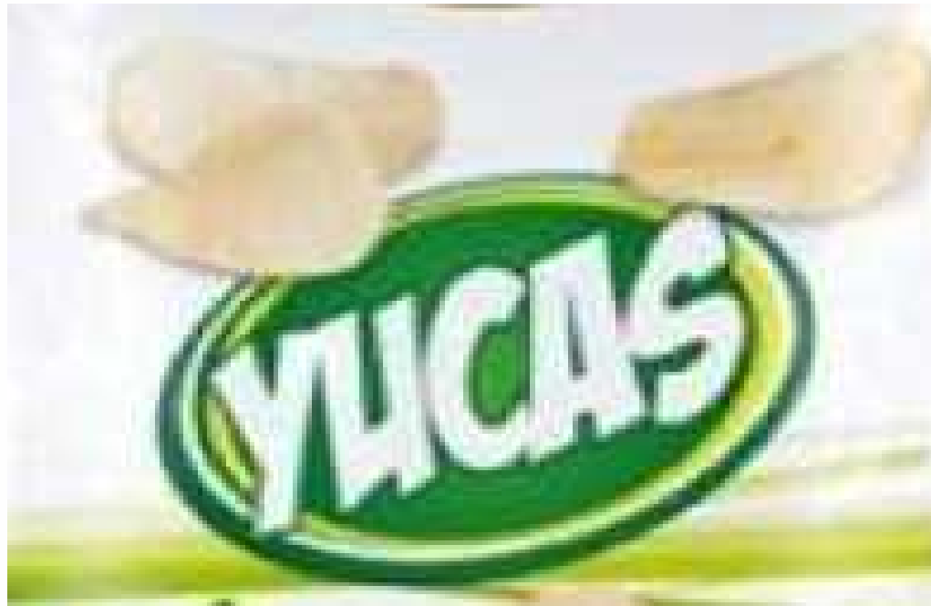
LOGO TIPO DEL PRODUCTO