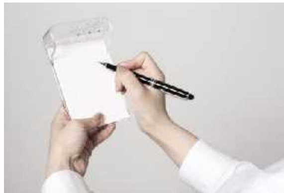
Centro de Emprendimiento

Aunque la principal función del producto es hacer sentir a las mujeres, bellas, glamurosas y que pueden despertar miradas e incluso envidia.